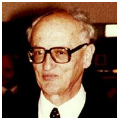
Клаус Самельсон, один из создателей языка ALGOL (1918-1980)