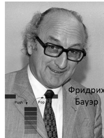
Фридрих Л. Бауэр, 1924-2015